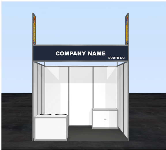
図はイメージです。