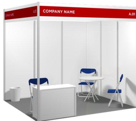
<パッケージブース(9㎡)イメージ>

社名板、丸テーブル x1、インフォメーションカウンター x1、折りたたみ椅子 x3、蛍光灯 x2、ゴミ箱 x1、電源 (220A/5A)x1、カーペット、スポットライト(100W)x2